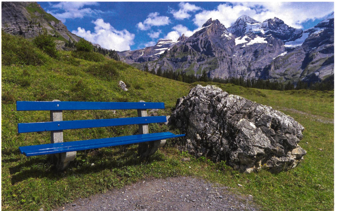
► 2 Bänkli helfen den Menschen dabei, Übersicht und Ausblick zu gewinnen. Bänkli am «Weg der Schweiz» zwischen Seelisberg UR und Bauen UR.

Bänkli sind seit Jahrhunderten Teil einer lebendigen Tradition, Ausdruck eines in den Alltag integrierten, immateriellen Kulturerbes. Als solches sind sie ein Spiegel ihrer Zeit und ihrer Werte. An historischen Aufnahmen von Bänkli können wir ablesen, was von ihrem Standort aus als sehenswert gilt und wie der sitzende Aufenthalt in der Natur oder im öffentlichen Raum «korrekt» zu erfolgen hat. Öffentliche Sitzbänke sind – im Gegensatz zu individuellen Bänken, die vor Bauernhäusern oder in privaten Gärten stehen – ein Symbol der Gastfreundschaft und gleichzeitig ein Bindeglied zwischen Mensch und Natur: An den schönsten Plätzen mit besonderen Aussichten werden Sitzgelegenheiten zum kostenlosen Verweilen angeboten. Als «stille Kultur» sind Bänkli aber oft nur ungenügend dokumentiert und ihre touristische, gesundheitliche, soziale und soziologische Bedeutung ist kaum erforscht.