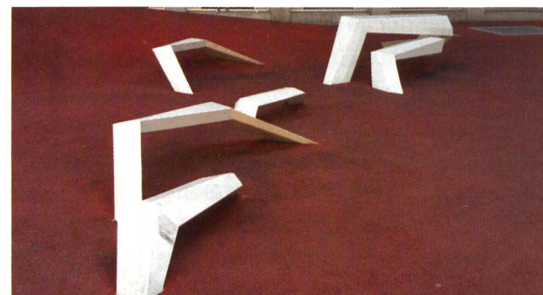
► 7, 8 «Liegendes Sitzen» in Wien und die «Wurzeln des Metallenen Baums» in Lausanne-Flon VD von Designer Samuel Wilkinson in Kollaboration mit Oloom.