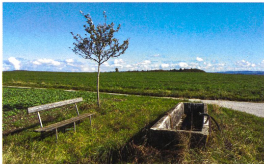
► 5 «Sitzkomfort» aus einer anderen Zeit, irgendwo im Waadtland.