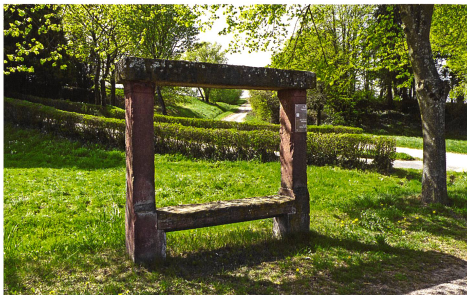
▲ 6 «Banc Reposoir» bei Kutzenhausen (Bas-Rhin), 2011. Bänke wie diese mussten 1811/1812 im Elsass – jeweils zusammen mit vier bis fünf Bäumen – anlässlich der Geburt des Sohnes Napoleons I. und seiner Ehefrau Marie-Louise errichtet werden, um Reisenden, Landarbeiterinnen und Landarbeitern Erholung zu geben.

und Wanderungen setzen. Nicht zuletzt erhöht das Vorhandensein von öffentlichen Sitzgelegenheiten auch den Aktionsradius von mobilitäts eingeschränkten Personen und ihre mögliche Aufenthaltsdauer im Freien. Rechnet man ihre Begleitpersonen mit ein, so sind Sitzbänke für mindestens einen Viertel der Bevölkerung zumindest zeitweise eine wesentliche Voraussetzung für ihre Teilhabe am öffentlichen Raum.