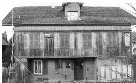
Vor dem Umbau