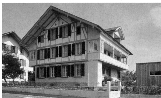
Nach dem Umbau

wir hier zusätzlich von einer vorbildlichen, durch die kantonale Denkmalpflege betreuten Sanierung berichten. Ende gut alles gut? Nicht ganz. Der Heimatschutz hat viel riskiert. Die Mitwirkung des Berner Heimatschutzes bedeutete hier für den Verein, auch Risiken einzugehen, da das nicht beliebte Mittel der Einsprache und später sogar dasjenige der Beschwerde angewendet werden musste. Diese Massnahmen tragen jeweils dazu bei, in gewissen Kreisen unseren Ruf als Verhinderer zu verfestigen und folglich auch das Verbandsbeschwerderecht zurück auf die politische Traktandenliste zu bringen. Da unsere Bauberatung nicht oft zu diesem Mittel greifen muss, sei an dieser Stelle kurz die ganze Palette der Dienstleistungen unserer Bauberatung