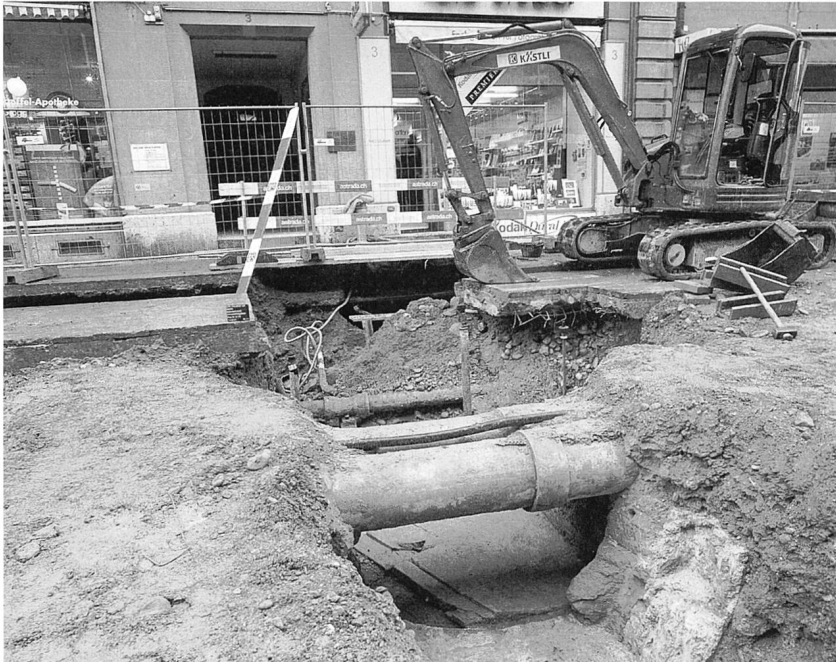
Archäologie in einer Grossbaustelle: Die Freilegung und Dokumentation der Reste eines Grabenturms in der Christoffelgasse zwischen Leitungen und Baggern.

Die Kosten dieses Projektes tragen der Bund, der Kanton, der Lotteriefonds und die Stadt Bern.