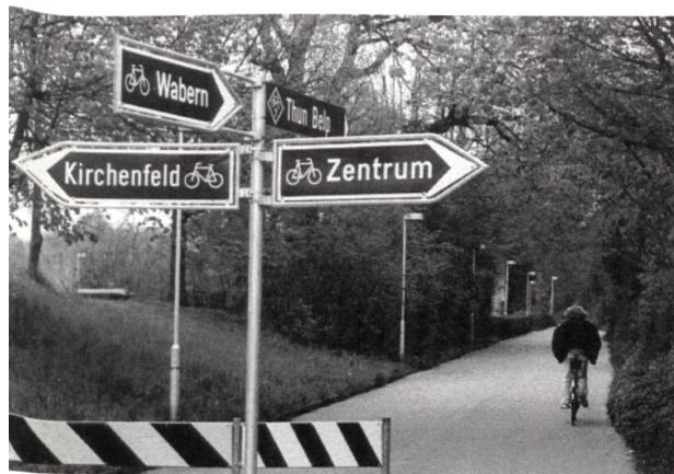
Das Trasse der Gaswerkbahn dient heute als Veloweg.