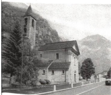
... heute kann der Haupteingang wieder benutzt werden.

1998 steht der Talerverkauf unter dem Patronat des Schweizer Heimatschutzes. Aus dem diesjährigen Talerverkauf werden drei Gemeinden unterstützt, die ihre Wege und Strassen so gestalten, dass sie zu einem erlebbaren und lebenswerten Teil des Dorfes werden. Strassen verbinden zwar Dörfer und Menschen, aber sie beeinträchtigen unsere Lebensqualität zum Teil beträchtlich.