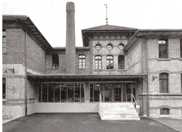
Ehemalige Parkettfabrik (heute Schulhaus Werk- jahr) mit dem neuen Eingangsbereich, Sulgenbachstrasse 18

oder konnten ohne grössere Schwierigkeiten bewahrt werden. Lassen Sie mich einige hiesige Beispiele aufführen – die Namen dazu werden Sie schon finden.