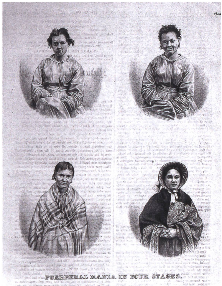
La folie puerpérale en quatre stades («Puerperal mania in four stages»). Medical Times Gazette, 1859

internées, les mères présentent des formes de folie spécifiques. Au delà d'une série de controverses autour de l'étiologie et de la symptomatologie, le diagnostic se stabilise au cours du 19 e siècle et il devient courant. Dans un dictionnaire de médecine, publié en 1872, on peut ainsi lire à l'entrée «folie puerpérale»: «Cette espèce comprend toutes les formes d'aliénation qui se développent chez la femme, à l'occasion des différentes phases des fonctions génératrices, la gestation, la