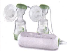
2in1 Doppelmilchpumpe / Tire-lait 2en1 double