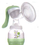
Handmilchpumpe / Tire-lait manuel

96%* Weiterempfehlungs- rate bei Schweizer Mamis