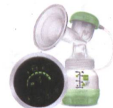
2in1 Einzelmilchpumpe / Tire-lait 2en1 individuel