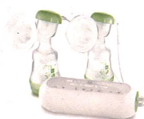
2in1 Doppelmilchpumpe / Tire-lait 2en1 double