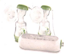
2in1 Doppelmilchpumpe / Tire-lait 2en1 double