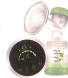
2in1 Einzelmilchpumpe / Tire-lait 2en1 individuel