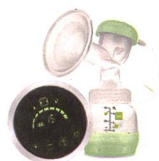
2in1 Einzelmilchpumpe / Tire-lait 2en1 individuel