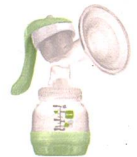
Handmilchpumpe / Tire-lait manuel

96%* Weiterempfehlungs- rate bei Schweizer Mamis