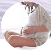
Akupunktur Ausbildung für Schwangerschaft, Geburt, Wochenbett und Stillzeit