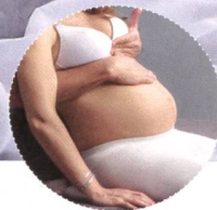
Osteopathische Behandlung der Diaphragmen für Hebammen