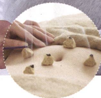
Akupunktur und Moxibustion in der Schwangerschaft