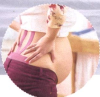
Schwangerschaft bis Wochenbett: Taping für Hebammen

SVH-anerkannte Fort- und Weiterbildungen bei AcuMax Med AG