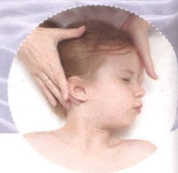
Faszien Distorsions Modell (Säuglinge/Kinder) Kurs