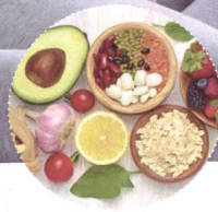
Nahrung fürs Blut - Eisen, Vitamin B12, Folsäure und Co.