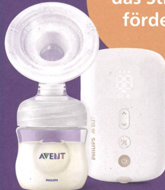
Einzelmilchpumpe Premium SCF396/11