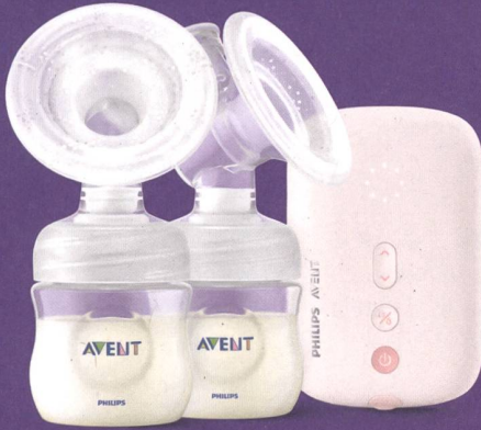
Doppelmilchpumpe Basic SCF397/11