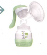
Handmilchpumpe / Tire-lait manuel

MAM 2in1 Doppelmilchpumpe : Effizienz und Komfort perfekt kombiniert. MAM Tire-lait double 2en1 : L'association parfaite de l'efficacité et du confort.