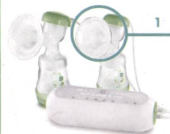
Elektrische Doppelmilchpumpe / Tire-lait électrique double

In 2 einfachen Schritten zur Handmilchpumpe wechseln / Passage en seulement 2 étapes au mode manuel