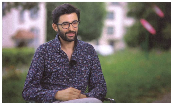
La naissance d'un père recueille le témoignage de dix-huit (futurs) pères.

Ce contact a parfois aussi été révélateur des nouvelles responsabilités à venir: «Beaucoup de joie et une petite sensation d'inconfort en disant "Mon Dieu!" Pas "Mon Dieu qu'est-ce que j'ai fait!" mais "Mon Dieu. Waow! Voilà! Je dois prendre soin de ce bébé, il y a des responsabilités qui arrivent tout d'un coup!» Mais c'est beau comme