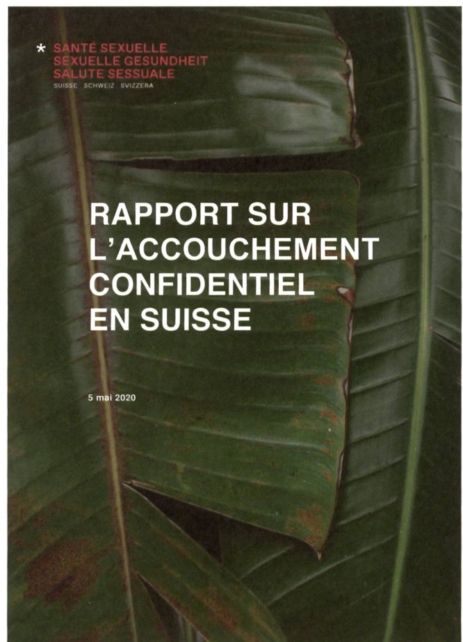
Le rapport de SANTE SEXUELLE SUISSE publié en mai 2020, www.sante-sexuelle.ch

Le médecin prend rendez-vous pour elle dans un centre de conseil en matière de grossesse, où les spécialistes ont l'expérience des situations complexes de ce genre. Il organise également un examen gynécologique. Différentes options sont discutées avec Madame F., y compris l'implication des parents, l'autorisation d'adoption et l'accouchement confidentiel. Madame F. s'informe sur l'adoption en consultant les sites référencés et mis à disposition sur le