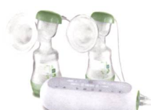
2in1 Doppelmilchpumpe / 2in1 Tire-lait double

Kontaktieren Sie uns für eine Terminvereinbarung. Veuillez nous contacter pour un rendez-vous.