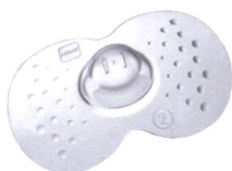
Stillhütchen / Protège-mamelon