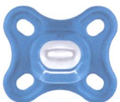
Comfort™ 0+m 1'400-6'500 g