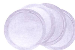
Stilleinlagen Coussinets d'allaitement