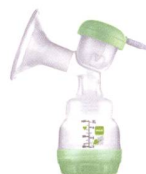
2in1 Einzel milchpumpe 2en1 tire-lait individuel