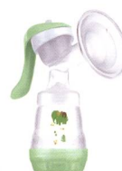
Handmilchpumpe Tire-lait manuel