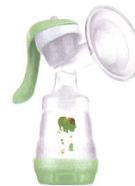
Handmilchpumpe Tire-lait manuel