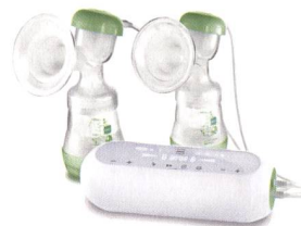
2in1 Doppel milchpumpe 2en1 tire-lait double