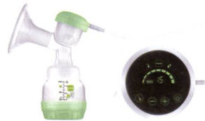
2in1 Einzel milchpumpe 2en1 tire-lait individuel