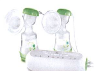
2in1 Doppelmilchpumpe / 2in1 Tire-lait double

Kontaktieren Sie uns für eine Terminvereinbarung. Veuillez nous contacter pour un rendez-vous.