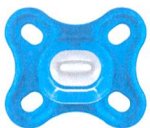
Comfort™ 0+m 1'400-6'500 g