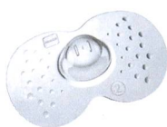
Stillhütchen / Protège-mamelon