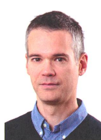
Raphaël Hammer, sociologue, professeur à HESAV, HES-SO. Ses recherches portent notamment sur la perception profane des risques dans le contexte de la grossesse, autour de la consommation d'alcool en particulier.