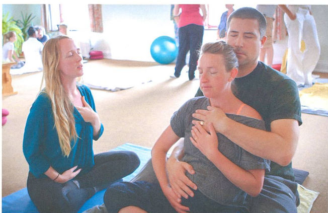
Praticienne de shiatsu travaillant avec un couple.