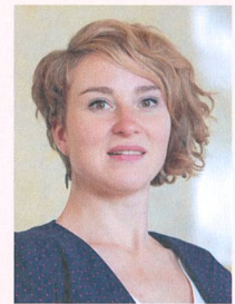
Irène Kälin, Nationalrätin Grüne, Aargau, ist Mitglied der Kommission für Wissenschaft, Bildung und Kultur und im Sommer 2018 zum ersten Mal Mutter geworden.