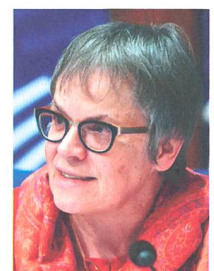
Liliane Maury Pasquier, conseillère aux États, sage-femme.