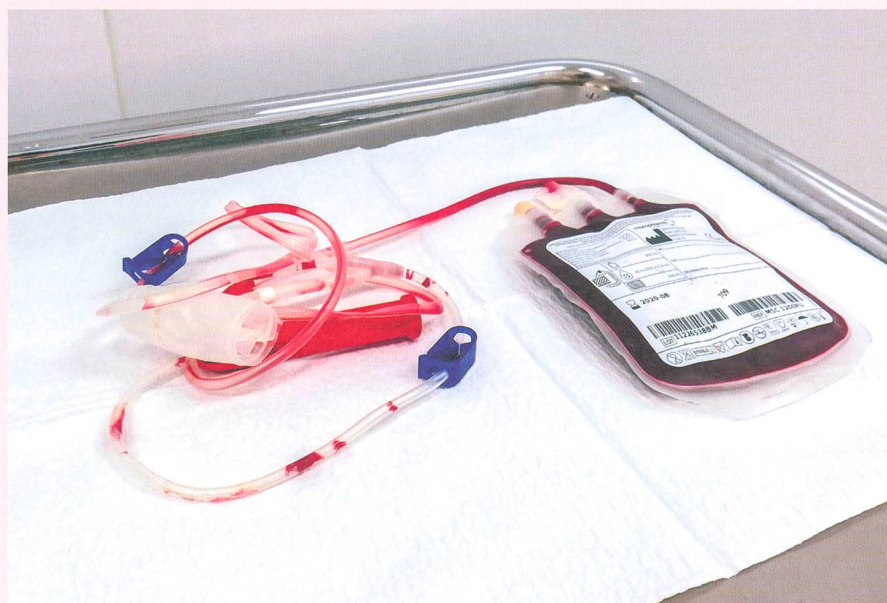
Prélèvement de sang de cordon.

avec le donneur (fraction de globule rouges), d'effectuer un typage antigènes d'histocompatibilité (HLA), pour la compatibilité avec le futur receveur de la greffe ( buffy coat ). Sur la fraction de plasma, des tests de stérilité sont effectués dans le but