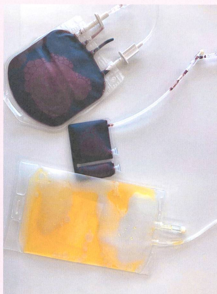
Les trois unités fractionnées: plasma, globules rouges et, au centre buffy-coat (cellules nucléées enrichies en cellules souches hématopoïétiques).