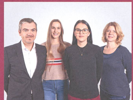
Il team di rubmedia AG, il nuovo partner per marketing e pubblicità.