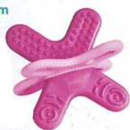
Bite & Relax Phase 2