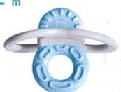
Bite & Relax Phase 1