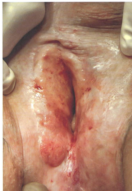
Über Jahre unbehandelter LS mit Krebsvorstufe an der rechten Labie.

sachen sind unbekannt, Schübe können aber v. a. durch Traumata im Genitalbereich ausgelöst werden. Auch Ernährung kann einen negativen Einfluss nehmen; berichtet wird von scharfem Essen oder auch säurehaltigen Getränken oder Zitrusfrüchten, die Unterschiede sind hierbei jedoch individuell erheblich. LS kann erblich sein, in etwa 50% der Fälle findet man weitere Familienangehörige, die betroffen sind (eigene, nicht publizierte Daten).