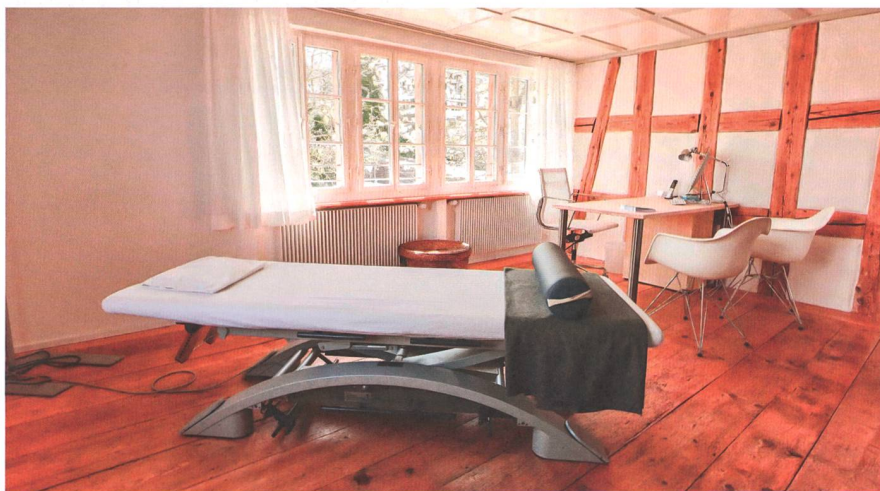
Komplementärmedizinische Behandlungen, die in diesem Zimmer durchgeführt werden, sind eine Ergänzung zum schulmedizinischen Ansatz.

Kurz nach der Eröffnung des komplementärmedizinischen Bereichs bot sich die Möglichkeit, weitere Räumlichkeiten in derselben Überbauung zu mieten. Nach eingehenden Beratungen mit Architekten, Medical Consulting und Finanzierungspartnern entschieden sich die Arcus-Gründerinnen dafür, eine Arztpraxis in das Konzept zu integrieren und verschiedene Ärzte der Grundversorgung unter einem Dach zu vereinen.