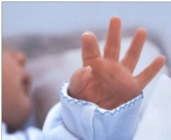
Clinique des Grangettes Genève

Située à Genève dans un espace calme et verdoyant, la Clinique des Grangettes est un établissement privé médical pluridisciplinaire qui dispose d'un plateau technique d'avant-garde.