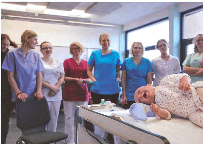
Die Studentinnen befassen sich im Skills-Center der Berner Fachhochschule Gesundheit mit Situationen aus allen Phasen der Schwangerschaft – hier mit der Betreuung des Säuglings im Wochenbett.