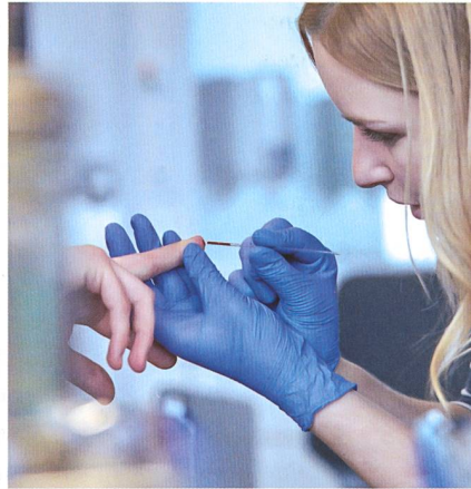
Die Bachelorstudentinnen eignen sich den aktuellen Stand des theoretischen Wissens an.

leicht einen Tag lang eine Einführung erhalten hatten, was wo steht oder abgelegt ist. Dieses «Funktionieren» braucht seine Zeit. Es wird in der Ausbildung nicht mehr gefordert. Vielleicht ist dieses «Funktionieren» der Grund, weshalb die Leute sagen, die frisch diplomierten Hebammen seien in der Praxis noch nicht so weit. Eine gute theoretische Ausbildung ist wichtig für eine gute Praxis und umgekehrt. Beide Seiten sollten nicht gegeneinander ausgespielt werden, das gefährdet den Gedanken der Autonomie.