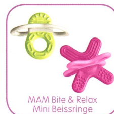
MAM Bite & Relax Mini Beissringe

*Alle MAM Produkte werden aus BPA und BPS-freien Materialien hergestellt.