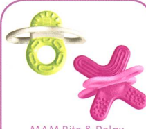
MAM Bite & Relax Mini Beissringe