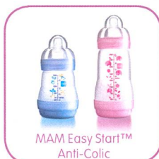
MAM Easy Start™ Anti-Colic