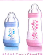
MAM Easy Start™ Anti-Colic