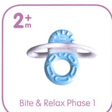
Bite & Relax Phase 1

MAM unterstützt seit über 40 Jahren Babys in ihrer individuellen Entwicklung.