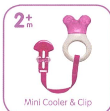
Mini Cooler & Clip