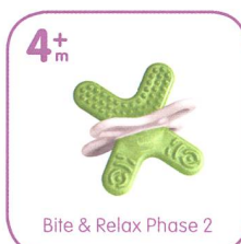
Bite & Relax Phase 2