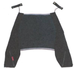
ExTend Stegerweiterung ab ca. 18 Monate