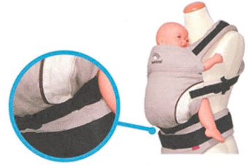
Size-It Stegverkleinerung ab Geburt