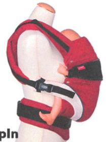
Zipln für eine noch bessere Rückenrundung ab Geburt