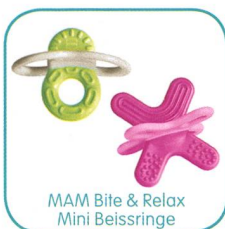
MAM Bite & Relax Mini Beissringe