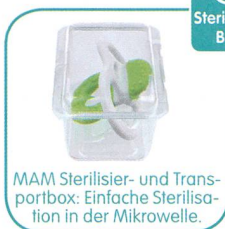
MAM Sterilisier- und Transportbox: Einfache Sterilisation in der Mikrowelle.