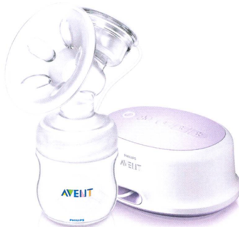
Tire-lait électrique Natural