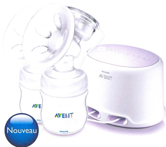
Tire-lait double électrique Natural

Les nouveaux tire-lait Natural de Philips AVENT ont été développés en collaboration avec les meilleurs spécialistes de l'allaitement en prenant exemple sur la nature. Ils permettent aux mamans de tirer leur lait de façon beaucoup plus confortable ce qui favorise la lactation.