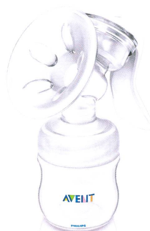
Tire-lait manuel Natural