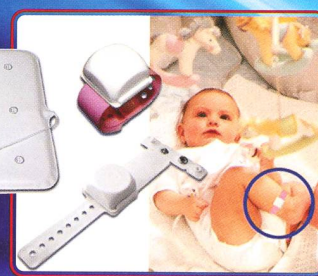
Surveillance · Sécurité