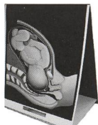
Neuerscheinung: der Geburtsatlas in Deutsch

•Fon: +49 6165 912 204 •Fax: +49 6165 912 205 •E-Mail: info@rikepademo.de •Internet: www.rikepademo.de