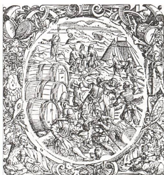
Aus: Paracelsus, Grosse Wundarznei.

Begeben Sie sich in dieser Weiterbildung zu den Spuren von Paracelsus. Sein Wissen und Wirken gilt als umfassend, was die Tatsache betrifft, den Menschen ganzheitlich zu betrachten. Spagyrika sind Arzneimittel, welche auf der Basis von alchemistischen Erkenntnissen hergestellt werden. Ausgangsmaterial sind pflanzliche, mineralische und animalische Stoffe. In diesem Seminar machen Sie sich vertraut mit dem individuellen Rezeptieren von spagyrischen Heilmitteln.