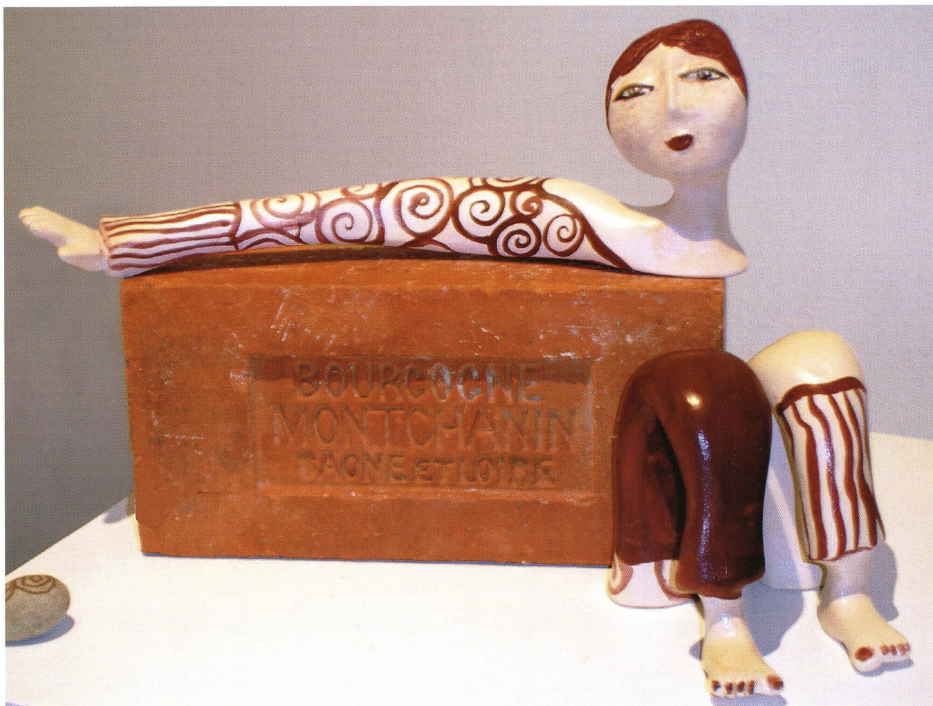
Illustrations Tout au long de ce dossier, Catherine Monnot-Vincent (13, Pré de la fontaine – 1217 Meyrin GE) présente ses poteries.