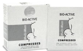
Die Multi-Mam Kompressen