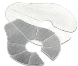
Das Temperature Pack

bieten Sie Ihr doch diese praktischen Produkte an.