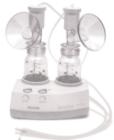
Modell: Lactaline Personal

Beachten Sie vor allem unser attraktives Mietsystem! (40 % Erlös aus Mieteinnahmen)