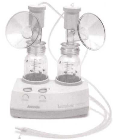
Modell: Lactaline Personal

Beachten Sie vor allem unser attraktives Mietsystem! (40 % Erlös aus Mieteinnahmen)