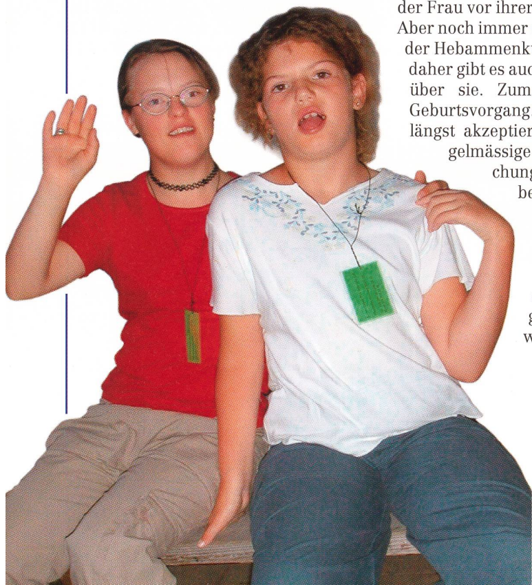
Vorgeburtliche Tests zur Erkennung von Down Syndrom oder anderen Entwicklungsstörungen belasten die Frauen.

Manchmal stellt uns unser Wunsch, den Frauen alle Fakten aufzuzeigen, vor Schwierigkeiten. Beispielsweise, wenn es um Tests zur Erkennung von Down Syndrom, Spina bifida und ande-