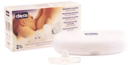
Brusthütchen / Protège-mamelon Code 64460.20