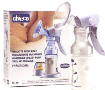
Milchpumpe / Tire-lait Code 69243