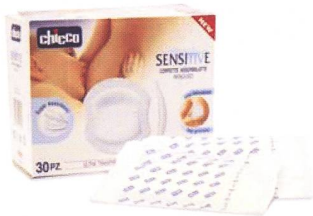
Stilleinlagen / Disques protège-seins Sensitive Code 69803-30 Stk.

FÜNF WICHTIGE PRODUKTE SPEZIELL ENTWICKELT, UM DAS STILLEN SORGLOS ZU ERMÖGLICHEN CINQUE PRODUITS SPÉCIFIQUES, ÉTUDIÉ POUR FACILITER L'ALLAITEMENT