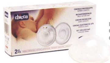
Milchauffangschalen / Coquilles recueille-lait Code 00073.20