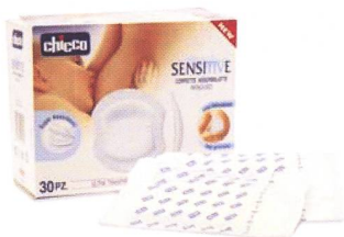
Stilleinlagen / Disques protège-seins Sensitive Code 69803-30 Stk.

CINQUE PRODUITS SPÉCIFIQUES, ÉTUDIÉ POUR FACILITER L'ALLAITEMENT