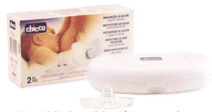
Brusthütchen / Protège-mamelon Code 64460.20