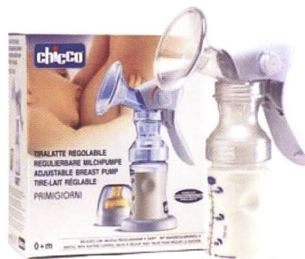
Milchpumpe / Tire-lait Code 69243