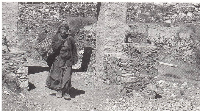
Egal ob hochschwanger oder gleich nach der Niederkunft: Eine Bäuerin auf dem Weg zur Feldarbeit.

In Kursen lernen Männer und Frauen, die Gründe für einen Uterusvorfall zu erkennen: Fehl- und Mangelernährung, der unhygienische Viehstall als Wochenbett, kurze Abstände zwischen den Schwangerschaften, vor allem aber die harte Arbeit und das Tragen schwerer Lasten auch hochschwanger und unmittelbar nach der Geburt.