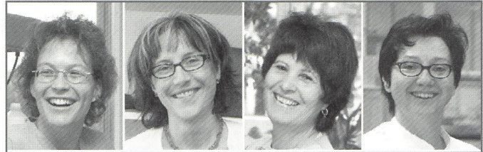
WILLKOMMEN IM KSW-TEAM

Gemeinsam mit Patientinnen und Patienten