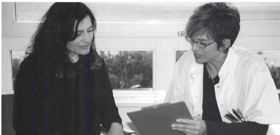
Im Gegensatz zum persönlichen Austrittsgespräch findet die schriftliche Klientinnenbefragung später und anonym statt.