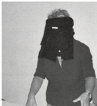
So blind war schon lange keine Glücksfee mehr!

Insgesamt 327 Leserinnen der Schweizer Hebamme, 290 aus der Deutschschweiz und 37 aus der Romandie,