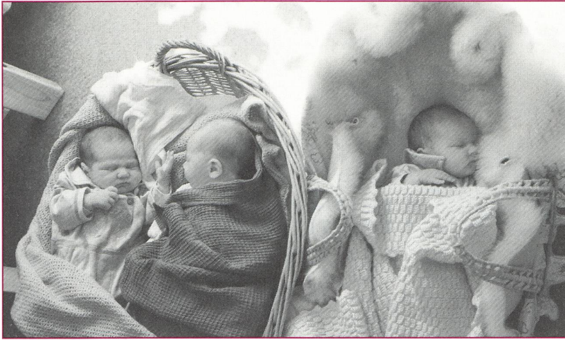
In der Schweiz kommen pro Tag durchschnittlich zwei künstlich gezeugte Kinder auf die Welt.