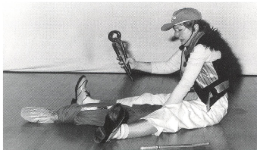
Merci aux Clownanalystes pour leur superbe prestation qui a permis à une audience subjuguée de comprendre la recherche de manière humoristique, sans enlever le sens de la présentation des intervenants, sans moquerie, mais avec finesse, respect, subtilité et tendresse.

Pour calculer le montant global destiné aux affections des nourrissons, on a rapproché le coût unitaire des maladies et le risque propre à chaque type d'allaitement. Compte tenu du fait