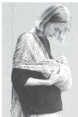
liegend in der »Wiege«

von Erna Hoffmann aus 100% ökologischer Baumwolle, Wolle oder Leinen, elastisch gewebt, waschmaschinenfest schöne Farben, viele Muster, in Längen bis 400 cm + mehr