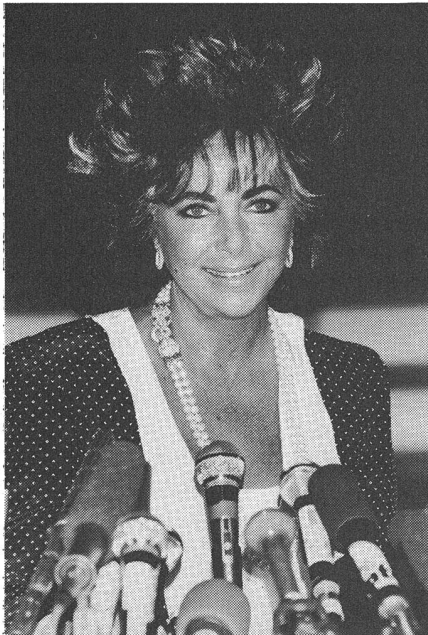
Wirbt um Verständnis für AIDS-Kranke: Liz Taylor